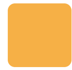
Tavola 1 Valutazione dei percorsi dello spazio pubblico